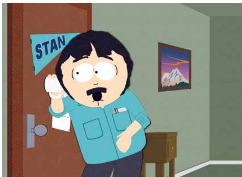
Bild ovan: Geologen Randy Marsh från South Park. Tabell 1, till höger: Amerikanska och brittiska biofilmer med geologer i rollistan.

Vi har därför försökt att hitta så många filmer med geologer som möjligt. Vi har koncentrerat oss på amerikanska och brittiska filmer som någon gång har visats i biograf. Det finns också minst tre svenska filmer med geologer "Ådalens